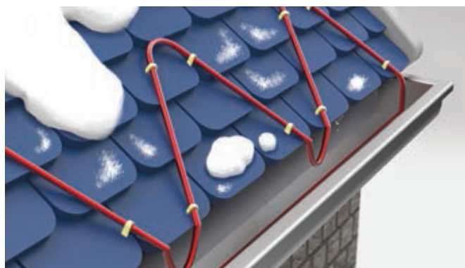
Полиолефиновая/фторполимерная оболочка с УФ-защитой